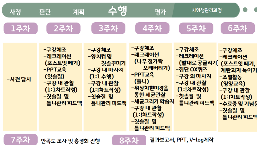
<Figure 2> Overview of the dental hygiene department and the service learning operation program by week plan

구조화된 면접 질문지를 토대로 면담을 진행하여 얻은 자료를 분석한 결과 <Table 6> <Table 7>과 같은 결과가 도출되었다.